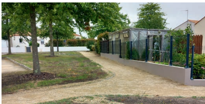
Aménagement du lotissement des Boutons d'Or

Des travaux de sablage ont été réalisés au lotissement «Les Boutons d'Or» au début de l'été. Pour cet automne, des travaux d'aménagement seront réalisés pour améliorer le chemin piétonnier allant du lotissement des Boutons d'Or au lotissement du Ferlin.