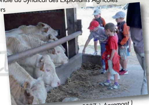
(Brin de Paille... en 2007 à Apremont)